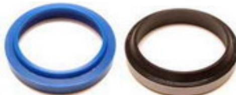
J OINTS RACLEURS