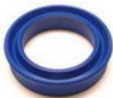
J OINTS TIGE A LEVRE