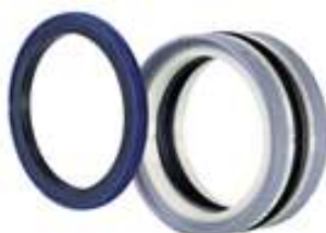
J OINTS PISTONS