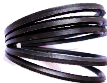
J OINTS CHEVRONS