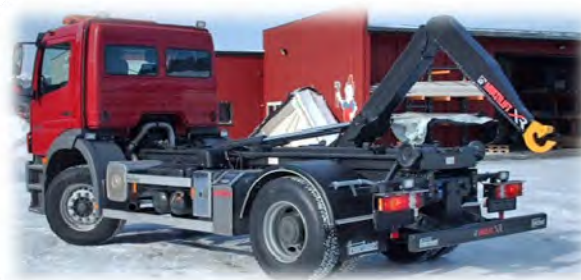
Appareil à bras