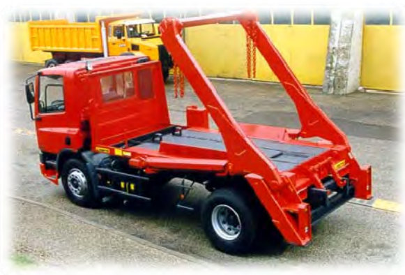
Portique à chaînes